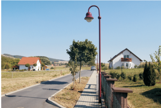
Baugebiet in Mihla